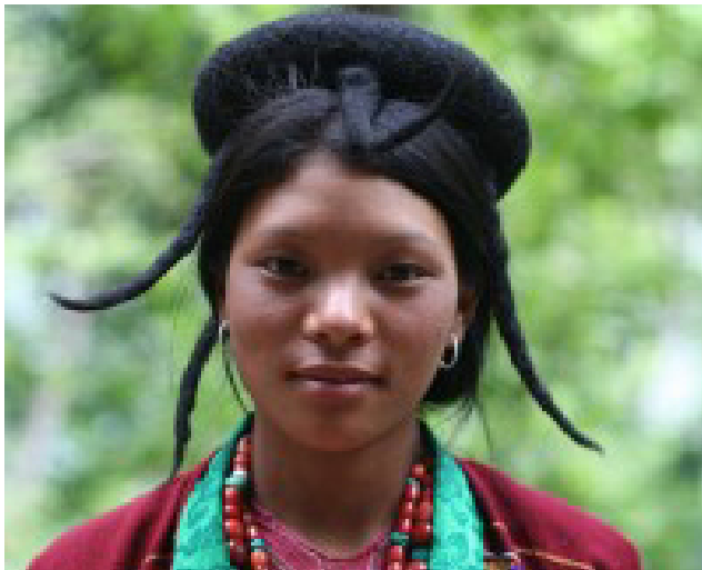
Typische Kopfbedeckung in Merak

Bhutan, am östlichen Rand des Himalayas gelegen, hat etwa die Grösse der Schweiz, aber nur ca. 700'000 Einwohner. Ich habe in den frühen 80er Jahren dort gearbeitet, es ist zu meiner zweiten Heimat geworden. Ein Gebiet ganz im Osten des Landes (im Distrikt Tashigang), MERAK und SAKTENG, ist neu für Touristen geöffnet. Wir bereisen diese Gegend zu Fuss und lassen uns bezaubern von der Unberührtheit von Natur und Menschen. Wir erleben die unterschiedlichsten Vegetationszonen, von der Indischen Ebene (ca. 300 m) bis zu 4000 m hohen befahrbaren Pässen mit Sicht auf die noch unbestiegenen Himalaya-riesen (7'500 m) an der Tibetischen Grenze. Ich freue mich auf den Kontakt mit meinen einheimischen Freunden, die uns wiederum einen speziellen Zugang gewähren werden. Maximal nehme ich 12 Reiseteilnehmende mit, alle 12 haben sich bereits definitiv angemeldet.